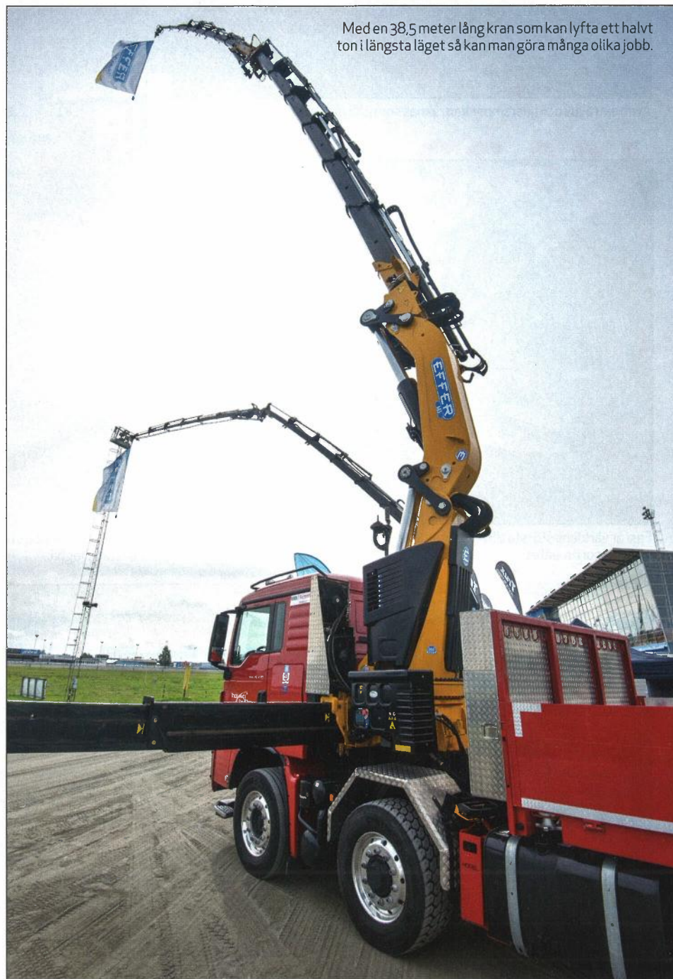
Med en 38,5 meter lång kran som kan lyfta ett halvt ton i längsta läget så kan man göra många olika jobb.