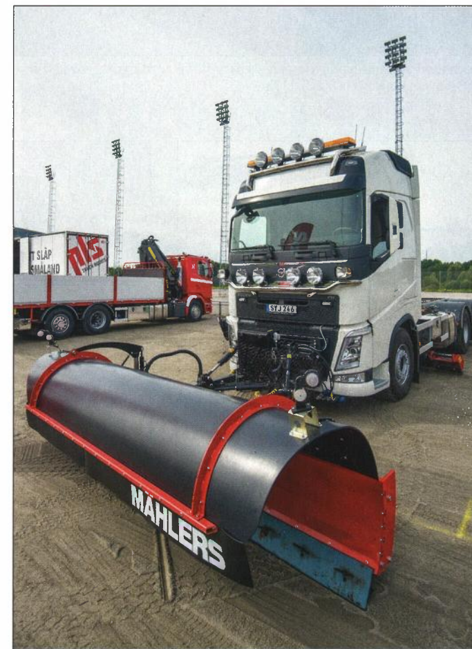
Norrländska Mählers hade tagit sig ner till Örebro för att visa upp en fullt utrustad plogbil.

Att flera svenska företag sedan väljer att dessutom tillverka produkterna på hemmaplan är givetvis ännu roligare. Det är med andra ord en bransch som lever och mår bra.