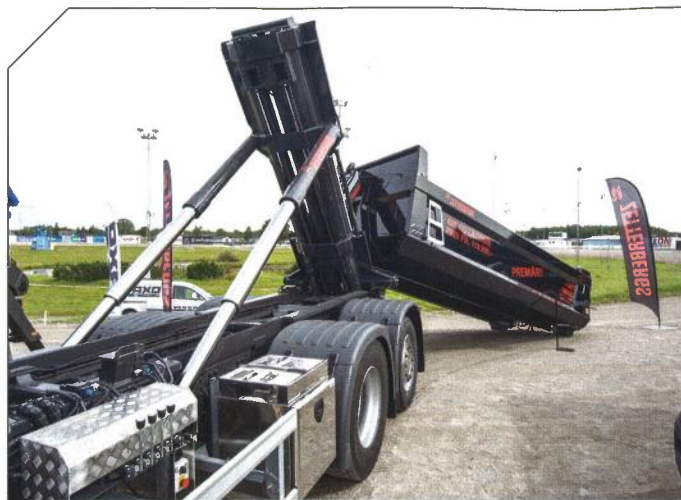
Zetterbergs visade upp sitt nya, svenskbyggda flak, med lägre egenvikt och ett till synes konkurrenskraftigt pris.