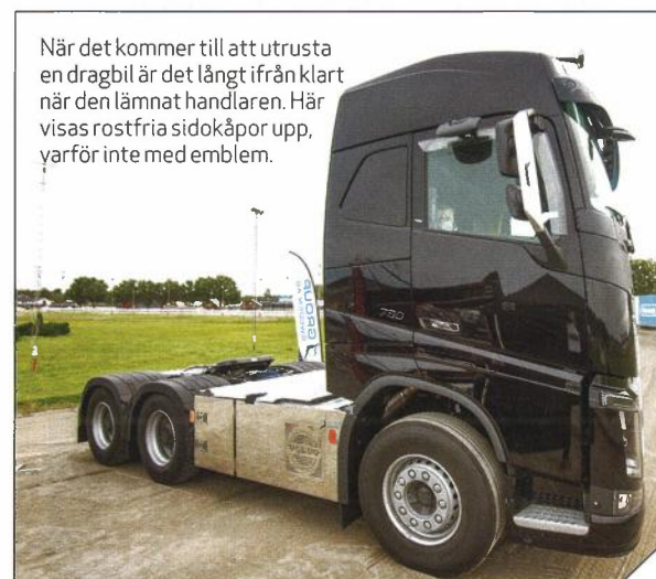
När det kommer till att utrusta en dragbil är det långt ifrån klart när den lämnat handlaren. Här visas rostfria sidokåpor upp, varför inte med emblem.

Påbyggnadsmässan är i alla fall ett trevligt initiativ som visar både bredden, längden och höjden i påbyggnadsbranschen.