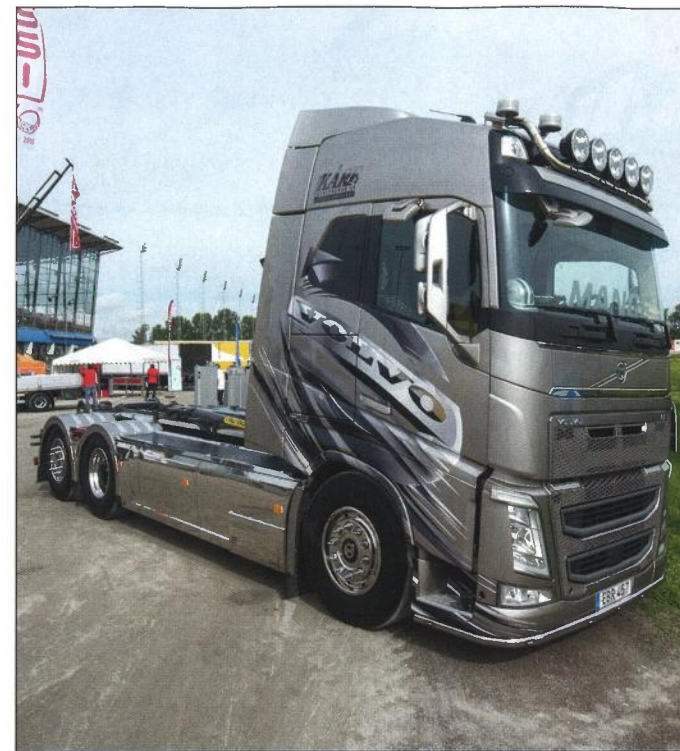
Även extraljus och ljusramper kan räknas som påbyggnader.

Påbyggnadsmässan är i alla fall ett trevligt initiativ som visar både bredden, längden och höjden i påbyggnadsbranschen. ■