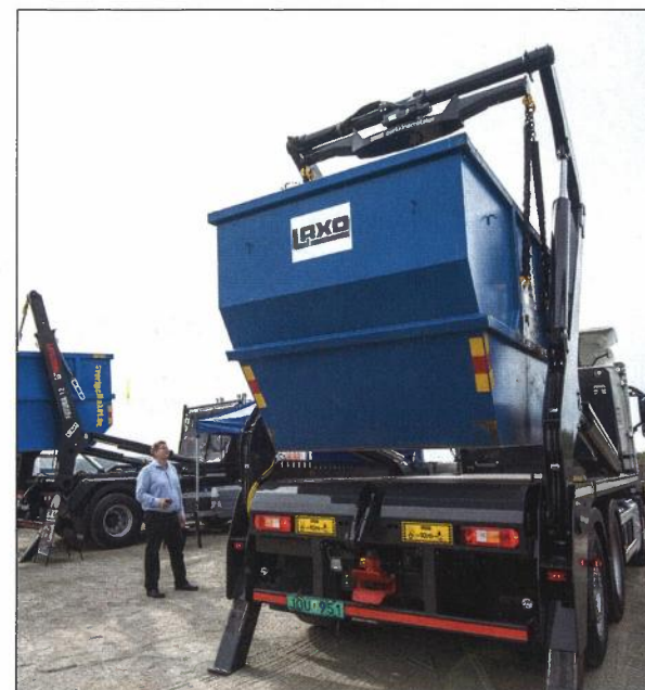
Laxå visade upp en ny typ av containerhantering, där containern kan svängas 380 grader för att enkelt passas in där kunden vill ha den.

Påbyggnadsmässan är i alla fall ett trevligt initiativ som visar både bredden, längden och höjden i påbyggnadsbranschen.