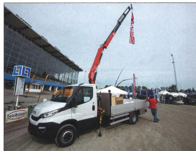
Fasi är världens största tillverkare av kranar, här visar de upp en av de minsta i sortimentet.

Att flera svenska företag sedan väljer att dessutom tillverka produkterna på hemmaplan är givetvis ännu roligare. Det är med andra ord en bransch som lever och mår bra.