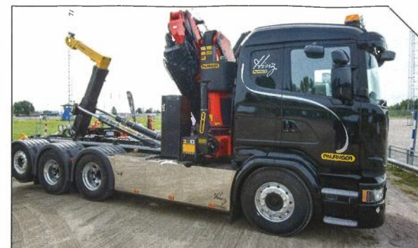
En kombinerad kran- och krokbil är ju inte fel, här i Palfingers utförande.