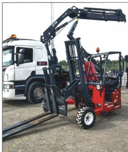
Hiab har ett brett sortiment av påbyggnader, men också påhängstruckar från Moffett.