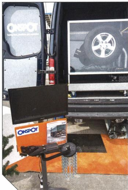
Onspot är en automatisk snökedja som fälls ut och lägger sig under drivhjulen. Smart och smidigt.