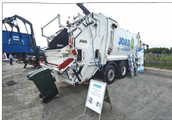
Lastbilar för sophantering är extremt specialbyggda, och utvecklas hela tiden för att få smidigare och snabbare hantering.